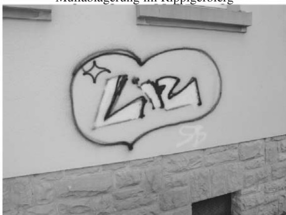
Graffitis an der Schule in Altrier