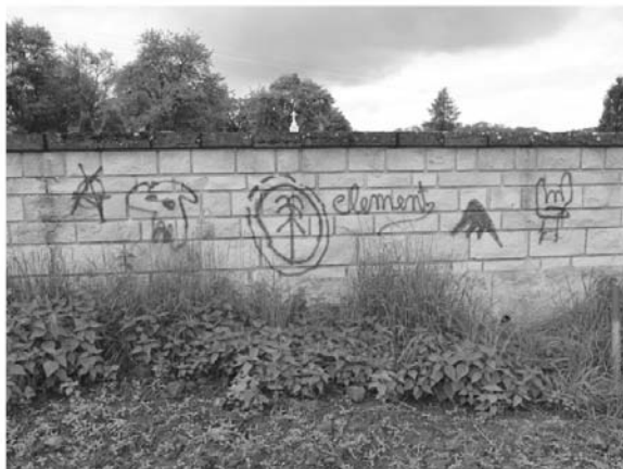
Graffiti an der Friedhofmauer in Altrier