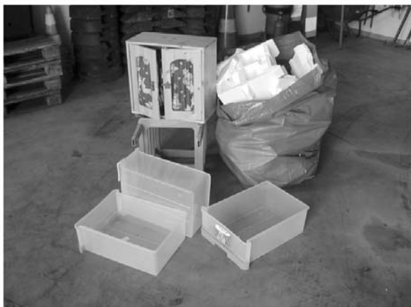
Müllablagerung im Rippigerberg

Die Gemeindeverantwortlichen müssen mit Bedauern feststellen, dass sich in letzter Zeit die Akte von Vandalismus (Graffitis sowie mutwillige Zerstörung) und auch illegaler Abfallentsorgung größeren Ausmaßes bedenklich gehäuft haben. Anhand der hier beigefügten Bilder kann ein jeder sich ein Bild über das verantwortungslose Handeln einiger Personen machen.