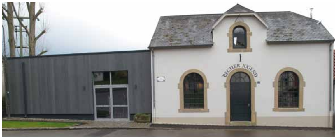
Neibau a Renovatioun vum Becher Jugendhaus