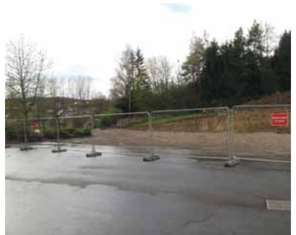
Aushubarbechten fir déi nei Schoul zu Berbuerg