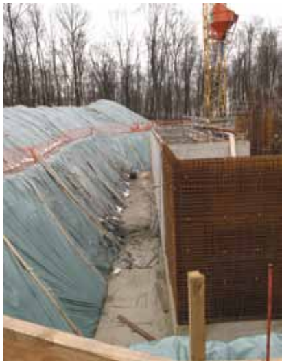
Bau vun den Buedembehälteren ënnert dem neien Waasserturm op der Schanz