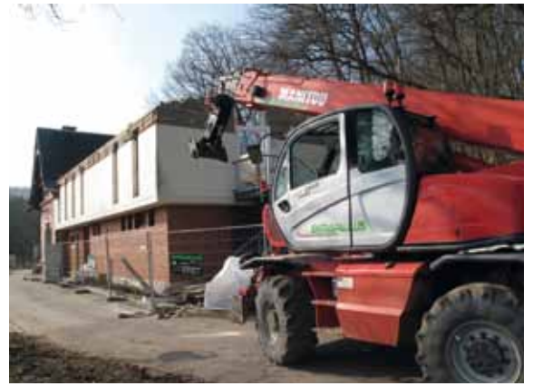
Ofrappen vun der Annexe vum Chalet op der Becher Gare